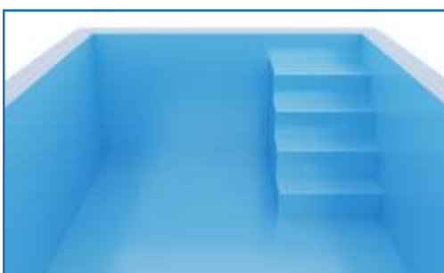
rechteckig in Ecke