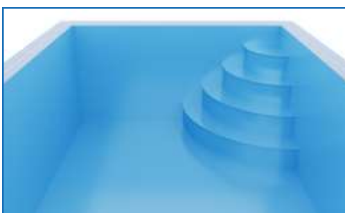
kreisförmig in Ecke (nur bei Auftragsproduktion)