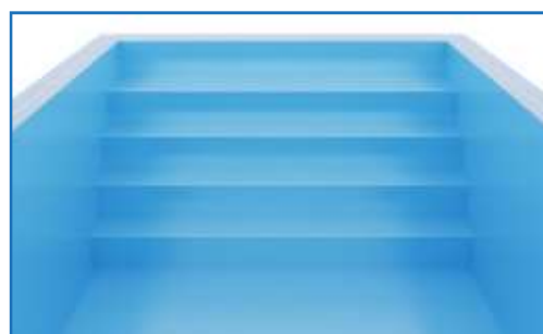
rechteckig (nur bei Auftragsproduktion)