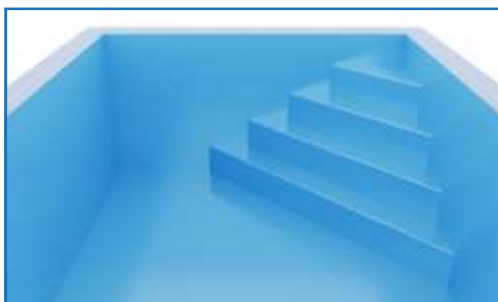
gerade über Eck

Unten stehend können Sie alle angebotenen Stufentypen ansehen. Sämtliche Treppen können in beliebiger Form, Größe sowie Farbe installiert werden. Die einzige Ausnahme sind sandfarbene und graue Swimmingpools, die wir nur mit der Treppe Aero herstellen.