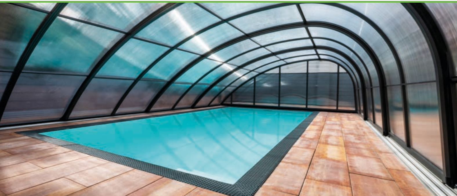
MONACO FUTURE MASSANFERTIGUNG - MÖGLICHE ABMESSUNGEN